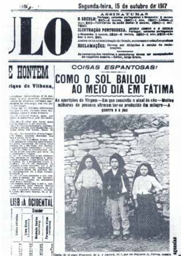
Photograph of the last apparition of October 13, 1917, when the sun began to “dance”

“We saw the angel holding in his left hand a chalice and suspended in the air above it, was a Host from which drops of blood fell into the chalice...”