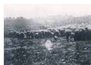
Photo of the crowd circled around the last apparition of 1917, before the sun began to “dance”