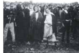
Photograph of the last apparition of October 13, 1917, when the sun began to “dance”